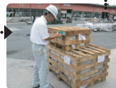
木枠梱包された製品に識別ラベル添付。