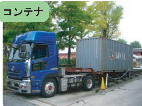
コンテナを積んだトレーラーが山形本社に到着。