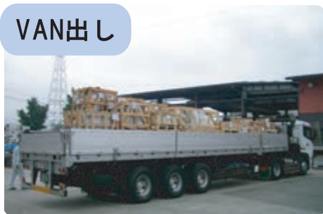
港で、事前にコンテナから荷降ろしした後、関東地方向けの荷物と分けてトレーラーで陸送する場合があります。【別紙資料あり】