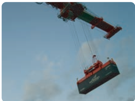
ガントリークレーンで船から荷降ろし。