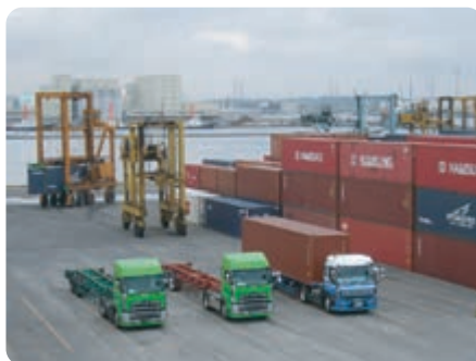
コンテナごとにトレーラーで陸送します。