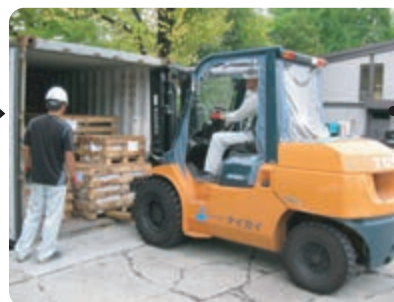
フォークリフトを使って製品の荷降ろし。